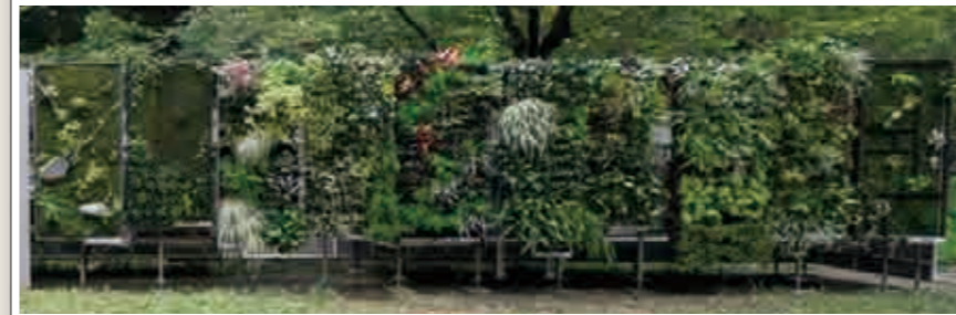
b. 「遮蔽型」壁面緑化技術