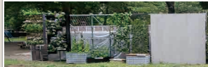
a. 「透過型」壁面緑化技術