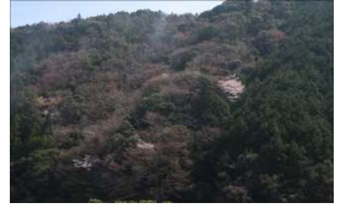
バス停柳瀬・川向こうの山斜面