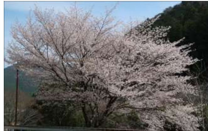
田辺・自然食品センター