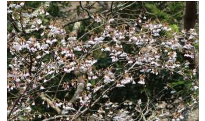
龍の里、まるしめ手前