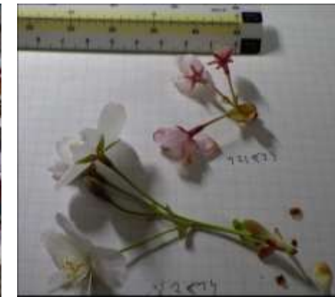
クマノザクラとヤマザクラ