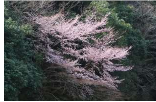
龍神村西・吊り橋・上流右岸