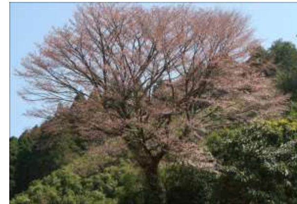
中野辺・売り物件・いっぽうすぎ