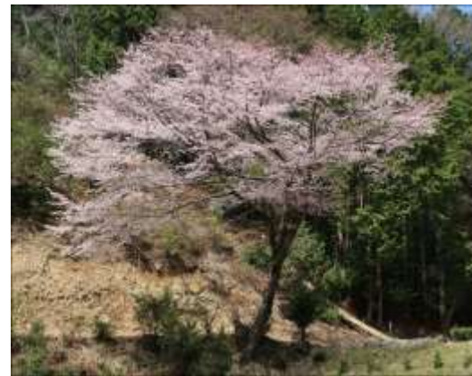
371号線左折・ゴルフ練習場脇