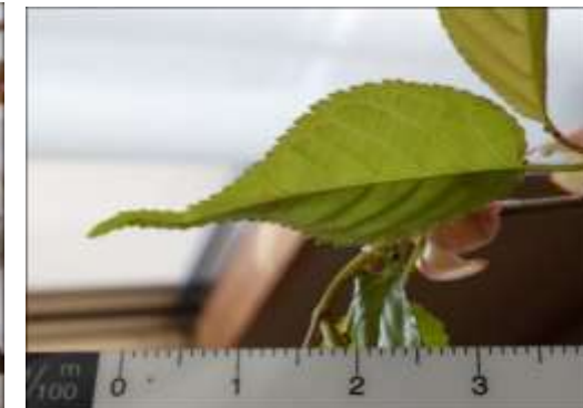
クマノザクラ（七越近く）